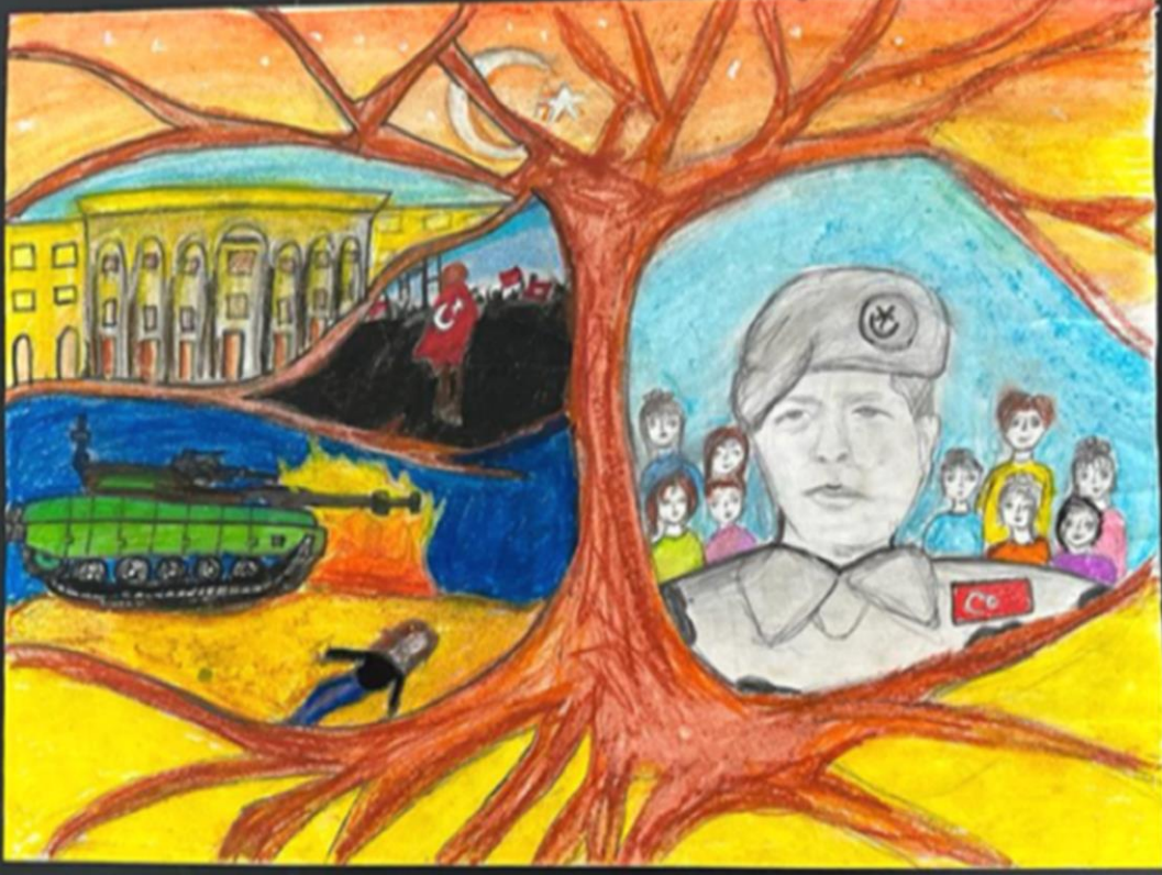
Funda Nur BAL 8/B