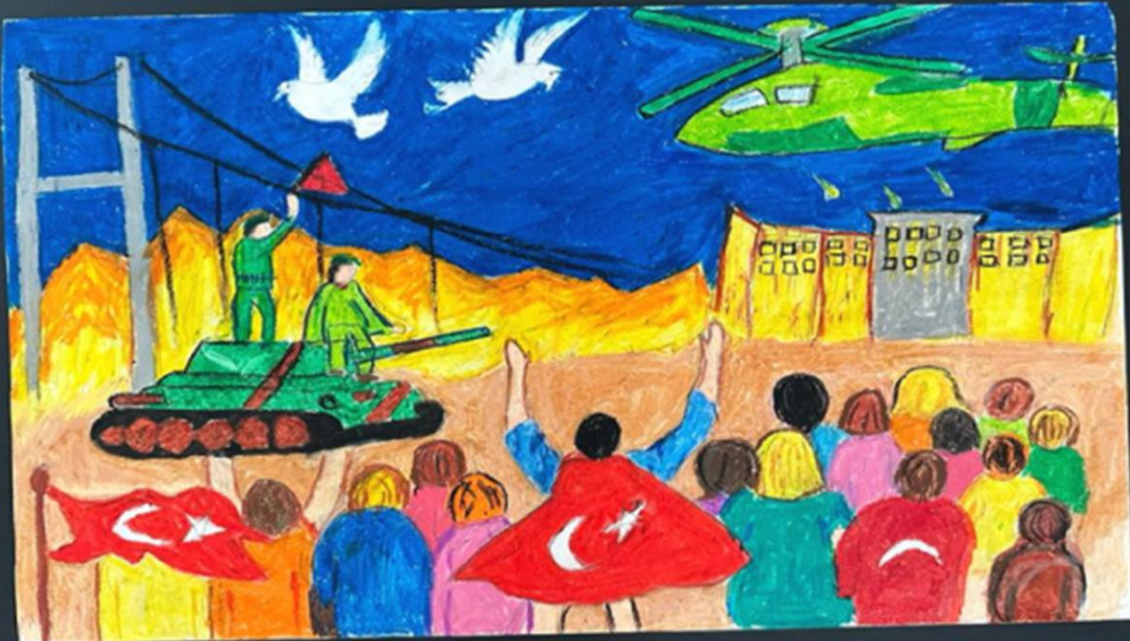
Melike DEMİR 8/A